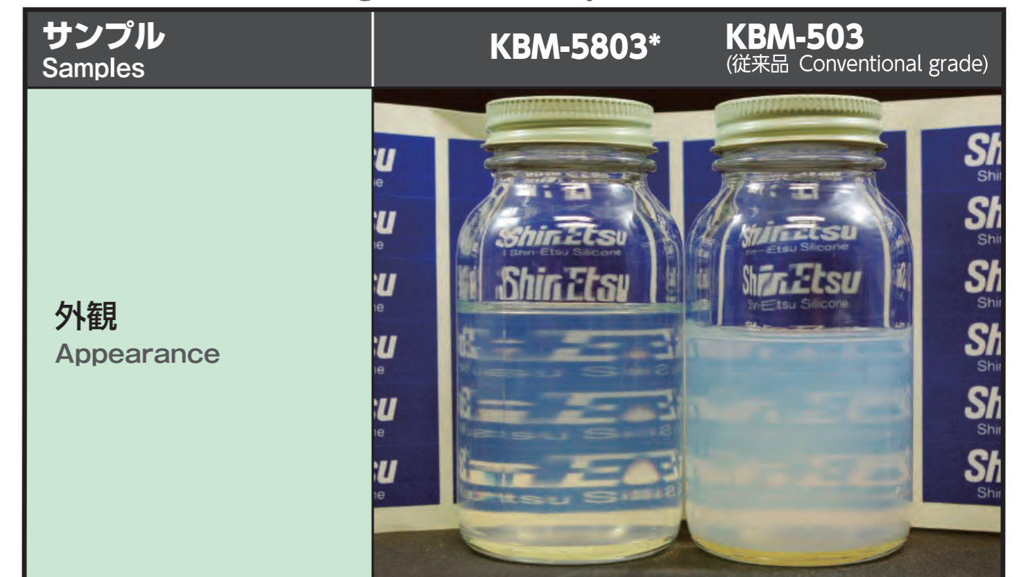
*左 Left : KBM-5803 分散性向上により、透明性向上 Owing to the improved dispersibility, transparency is improved.

■ 無機フィラー分散性評価 Evaluation of inorganic filler dispersion